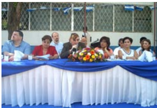
Lanzamiento del Manual de Prevención contra la Trata de Personas Instituto Benjamín Zeledón

Repatriación, Reinserción Escolar; con dicho proyecto piloto se dará atención y seguimiento aproximadamente de 5 a 7 casos en riesgo de trata de personas, asimismo se dará apoyo en la campaña de prevención y sensibilización a la población, en especial al sector mas vulnerable.