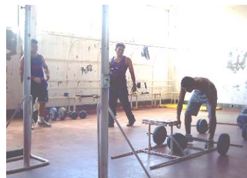
SALA DE DEPORTE SISTEMA PENITENCIARIO