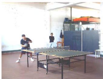
SALA DE DEPORTE SISTEMA PENITENCIARIO