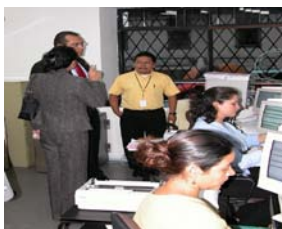
SERTRAMI COSTA RICA