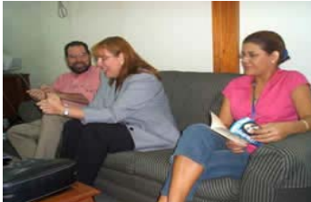
Vice Ministra de Gobernación en reunión con Junta Directiva de Medios escritos.

estableció un foro permanente con medios de comunicación y entrevistas en televisión y radio; se ha avanzado en sensibilizar a la población nicaragüense sobre la importancia de prevenir el delito y la violencia en aras de lograr una verdadera seguridad ciudadana que coadyuve a que Nicaragua goce de una verdadera práctica de gobernabilidad y Estado de derecho.