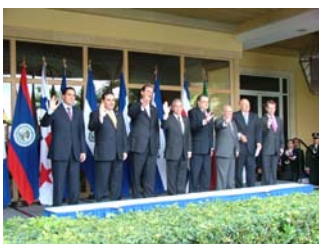
Cumbre DE Presidentes Centroamericanos 30 de junio 2005- República de Honduras,

Por primera vez los ciudadanos que tengan acceso a Internet pueden consultar los servicios, requisitos, base legal, estadísticas, consultas, impresión de la Tarjeta de Ingresos y Egresos (TIE), información de interés sobre los avances y acciones que se están desarrollando tanto a nivel Nacional como del proceso de integración migratoria centroamericana.